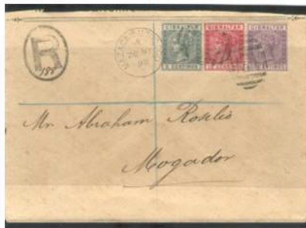
Lettre recommandée en 1898 Mazagan - Mogador