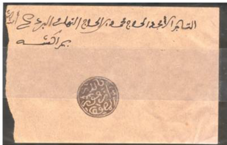
Courrier postal avec cachet rond Azemmour - Marrakech