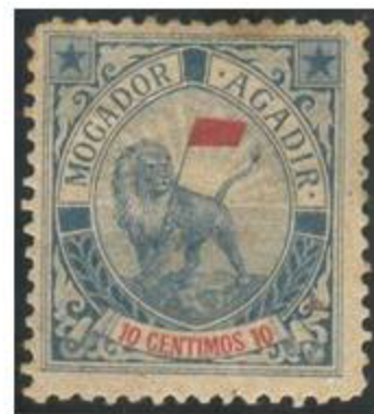
Mogador - Agadir