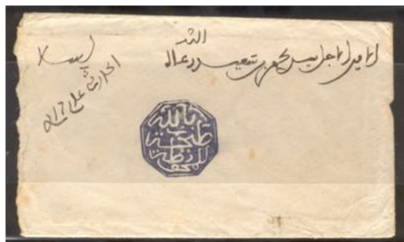
Courrier postal avec cachet octogone Tanger - Salé

La mise en service de ces cachets prit fin le 25 Mai 1912, date d'émission des premiers timbres-poste marocains.