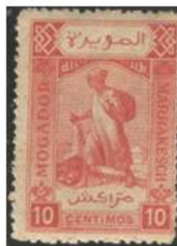
Mogador - Marrakech

Les timbres étaient imprimés à la diligence des propriétaires de ces lignes. Leurs figurines étaient souvent de piètre qualité d'impression.