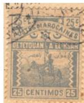
Tétouan /Ksar El Kébir